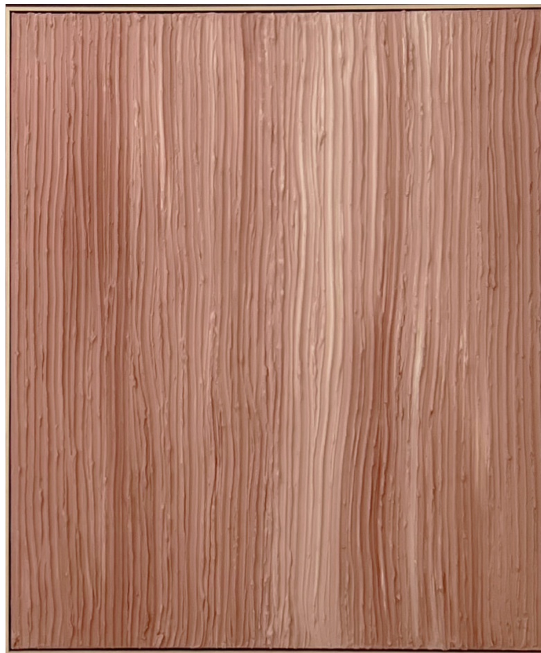
DÍTPICO 1: 2x 120 x 100 cm

Técnica mixta sobre lienzo de lino, 2022