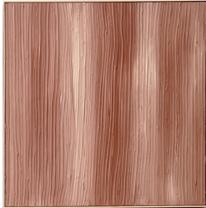
DÍPTICO 2: 2x 100 x 100 cm

Técnica mixta sobre lienzo de lino, 2022